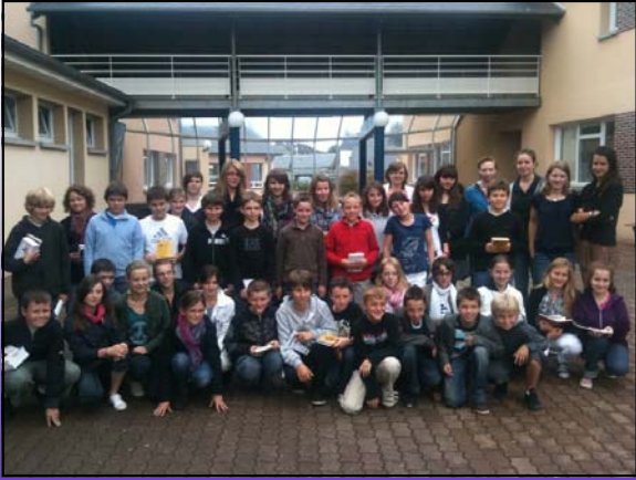
Le concours d'orthographe des 6 èmes