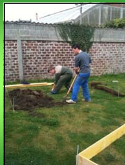
Le projet « jardin » des 3 èmes F