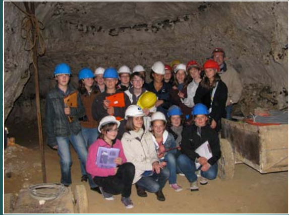
Le voyage en Angleterre et au Pays de Galles pour les 5 èmes