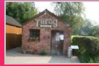
Échange Franco-Allemand pour les 4 èmes et 3 èmes